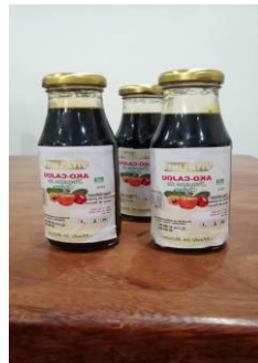
Miel de cajou