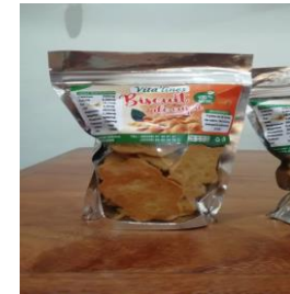
Biscuits de cajou