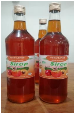
Sirop de cajou