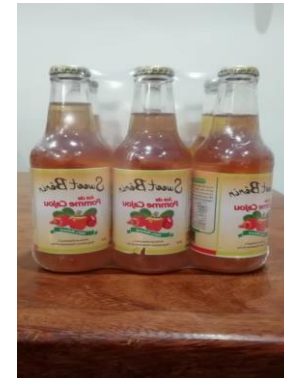
Jus de cajou