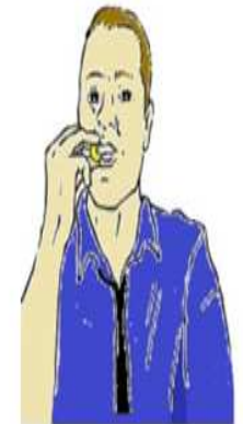
USA – Europe Noël/Nouvel An