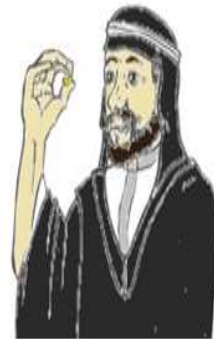
Asie et Afrique du Nord Ramadan (Dates variables)