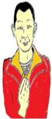
Chine, Asie du Sud-Est Nouvel An Chinois