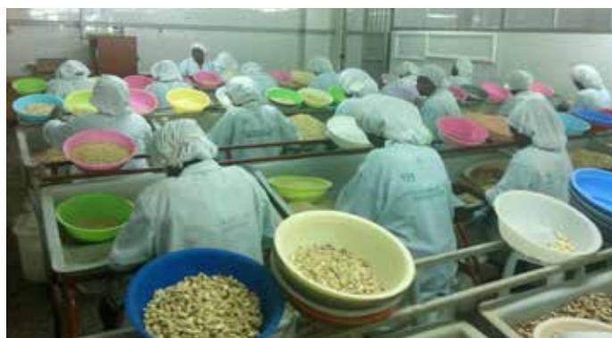
Employés d'Equatorial Nut Processors (ENP)

Mai : Deux des plus importants transformateurs de cajou du Kenya, à savoir ENP et Jungle Nuts, ont été re-certifiés par le programme du Label de qualité de l'ACA.