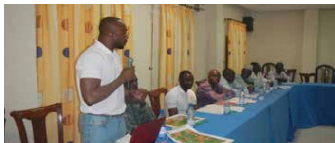
Ateliers animés par l'ACA sur les bonnes pratiques agricoles au Bénin

Septembre : Dans ses efforts visant à apporter un soutien aux producteurs agricoles en milieu rural, l'ACA a organisé son premier atelier de formation des formateurs (FdF) à l'intention de 20 représentants des régions nigérianes de production de cajou. La formation s'est tenue à Parakou, au Bénin et a couvert un large éventail de thèmes relatifs aux bonnes pratiques agricoles (BPA), y compris la gestion et l'entretien des plantations.