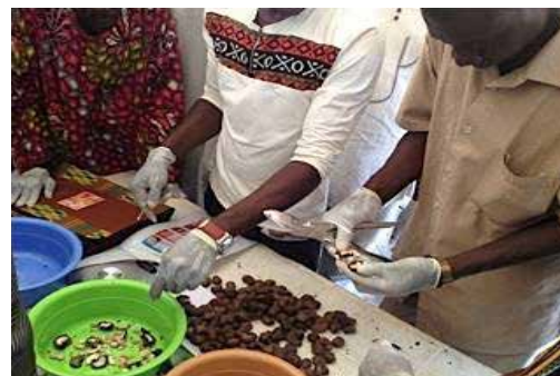
Formation aux meilleures pratiques pendant et après la récolte

la formation des formateurs le mois précédent. Ce partage de connaissances et de compétences apporte un appui à la mission du programme TIME de l'USAID qui est d'autonomiser les producteurs agricoles du cajou en milieu rural en vue d'améliorer leurs moyens de subsistance.