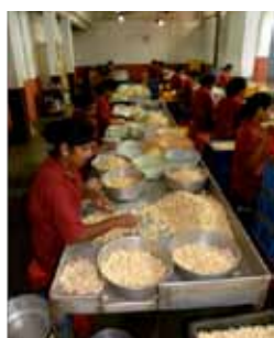
Zantye Cashew Factory: Un fournisseur d'anacardes originaires de Goa

L'offre des noix brutes a été raisonnablement bonne durant la saison passée. Les noix originaires de l'Afrique de l'est étaient moins importantes. Le Brésil a été légèrement retardé mais en général l'offre était suffisante pour faire fonctionner les usines. Pour les saisons à venir, la situation semble prometteuse pour l'Afrique