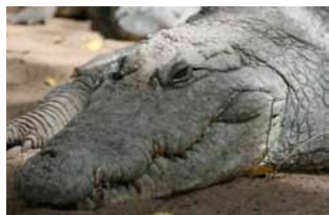
Le Katchkali de Gambie