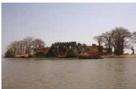
L'île James en Gambie