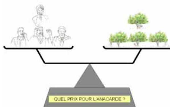
Exemple de support pédagogique utilisé par le projet pour former les producteurs d'anacarde au fonctionnement du marché international.