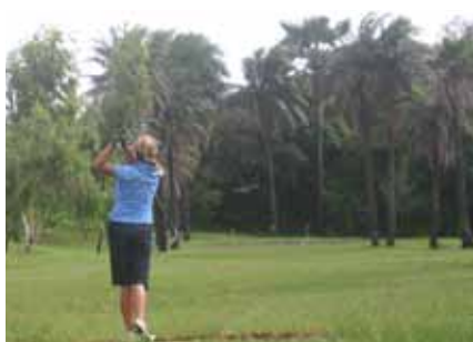
Le Golf de Gambie