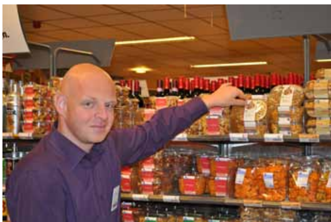
Des noix de cajou du commerce équitable sur les étagères des magasins Albert Heijn

Les clients des 761 magasins Albert Heijn situés aux Pays-Bas ont pu acheter des noix de cajou provenant du commerce équitable pour la première fois, en octobre dernier. Bien que le commerce équitable des noix de cajou ait été introduit aux Pays-Bas précédemment, relativement peu de petits commerces - et uniquement présents dans le circuit commercial alternatif européen - proposaient jusqu'alors ces produits. Cette évolution vers le marché grand public, sous la marque "pure &