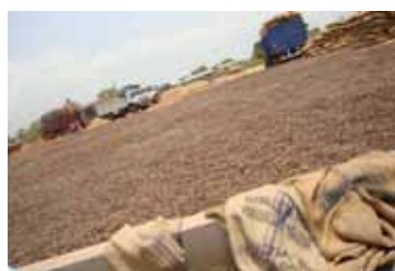
Commerce de noix brutes à Sampa, Ghana - mars 2011

Rien qu'en Afrique, 1 350 personnes ont participé à des événements nationaux sur le pour réunir des informations sur le marché mondial du cajou ou pour recevoir une formation sur les techniques