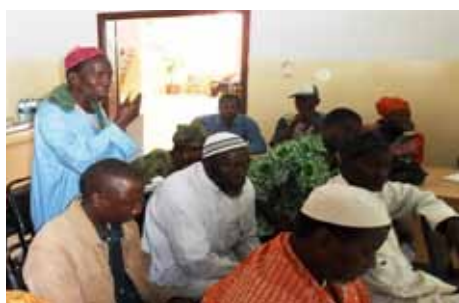
Des acteurs du secteur discutent de possibles petits contrats évolutifs au cours de la saison.

Les opérateurs gambiens du cajou travaillent avec le Comité National de l'ACA afin d'améliorer le secteur du cajou. Les producteurs de cajou, les associations, les commerçants locaux, les transporteurs et les exportateurs préparent maintenant le marketing pour la saison 2011 du